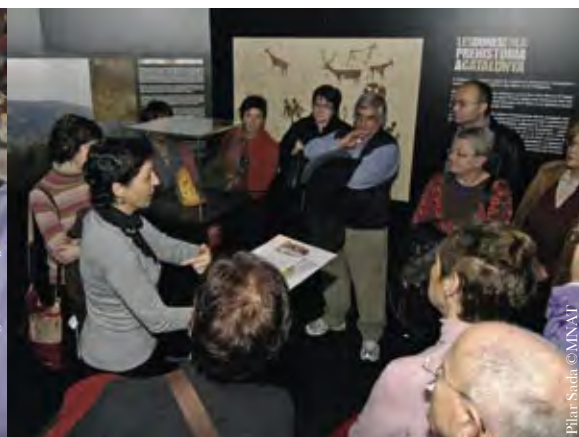
Pilar Sureda ©ANAU