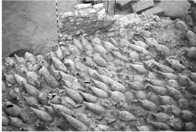
Figura 3.—Vista parcial del conjunto de ánforas