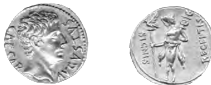
Figura 6.—El áureo hallado en las excavaciones de la plaza de Las Tenerías, Zaragoza. Escala 1:2