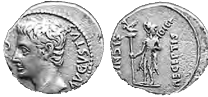
Figura 7.—Denario atribuido a una colonia hispana (¿Caesar Augusta? ¿Colonia Patricia?), con Mars Vltor portando los signa (RIC 82a)

A la vista de las circunstancias del descubrimiento nos parece adecuado proponer, en primer lugar, la Colonia Caesar Augusta como posible ciudad en la que se acuñaría la pieza, en tanto que ceca que pudo abastecer de numerario imperial, y el 19-18 a.C. —cronología que expertos numismatas atribuyen a los áureos de esta tipología—, como fecha de estas emisiones e indicativa de la fundación de la colonia. Procedemos además a realizar un análisis iconográfico que remite directamente al tema de la propaganda imperial, esto es, a la imagen que tan bien supo aprovechar y explotar Augusto (3) . En efecto, este áureo debe ser entendido como un eslabón más de una cadena ininterrumpida de imágenes del emperador, plasmadas en múltiples soportes entre los que se encuentra la moneda, y que nos sitúa en unos momentos en los que se estaba configurando la nueva concepción política del estado romano.