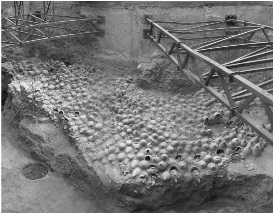
Figura 1.—Vista general de la excavación de la plaza de Las Tenerías de Zaragoza donde apareció el campo de ánforas

LAS excavaciones arqueológicas desarrolladas entre enero de 2003 y marzo de 2004 en un solar de la plaza de Las Tenerías de Zaragoza, en el centro histórico de la ciudad, han producido hallazgos relevantes que vienen a enriquecer el panorama general de la arqueología aragonesa en un marco temporal entre la época contemporánea y el periodo romano, a este último corresponden los vestigios mejor conservados ( fig. 1 ). Nos referimos al excepcional descubrimiento de un campo de 814 ánforas de variada tipología (1) , que fueron reutilizadas por los romanos para implantar un complejo sistema de drenaje en un sector de la ciudad donde confluyen los ríos Ebro y Huerva, y en particular de un denarius aureus a nombre de Augusto como parte del material arqueológico extraído.