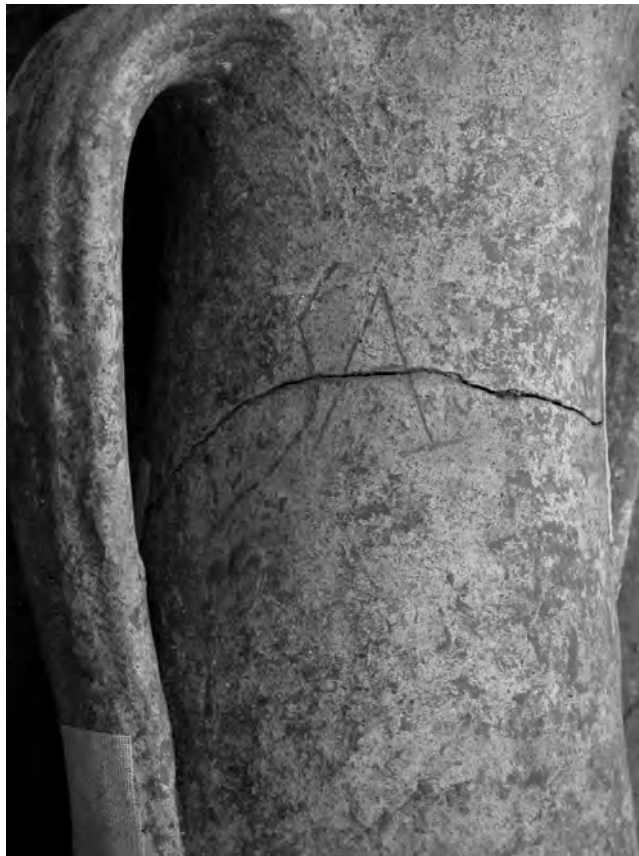
Figura 4.—Grafito aplicado sobre un ánfora muria