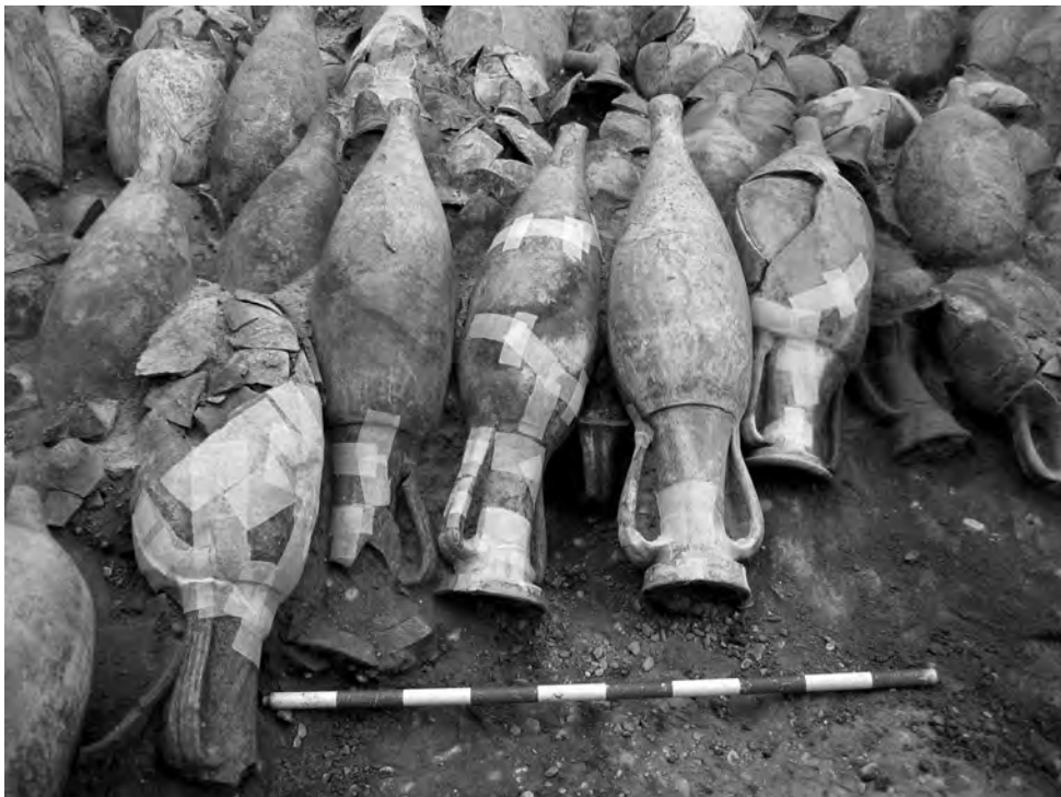
Figura 2.—Sector del campo de ánforas que cubría el estrato donde se halló el áureo

En la excavación de los niveles de época romana se detectaron dos fases, la primera estaba determinada por un relleno de tierra arcillosa mezclada con huesos de animales que se definió como un basurero; la segunda por las recargas sucesivas producidas en las operaciones de aterrazamiento del terreno integrando el conjunto anfórico: la capa inferior, que estaba formada por gravas y «lentejones» de arcilla extendidos sobre el lecho natural de una de las terrazas del río Ebro, es la que contenía el áureo. Sobre esta segunda capa se practicó una nueva nivelación empleando tierras de matriz arcillosa a la vez que se levantaron muros de contención con el fin de sujetar y afianzar las recargas superiores, en ellos se aprovecharon materiales de expolio, bloques y sillares de alabastro, caliza y arenisca, que se alzaron sobre una base de cantos con fragmentos de ánforas en las juntas para reafirmarlos. En este proceso se acotó un sector que acogería el campo de ánforas, las cuales se posicionaron vacías e invertidas con el fin de adecuar el terreno y evitar que las humedades alcanzaran el suelo edificable. Después de extender una capa de gravas sobre esta superficie de ánforas, se revistió todo con un estrato de arcillas más depuradas que las precedentes ( figs. 2-4 ).