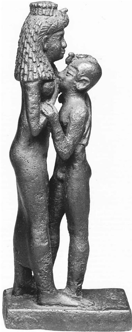
3. Escultura de cuerpo entero de Cleopatra y Kaisarion . Staatliche Museen, Berlin.