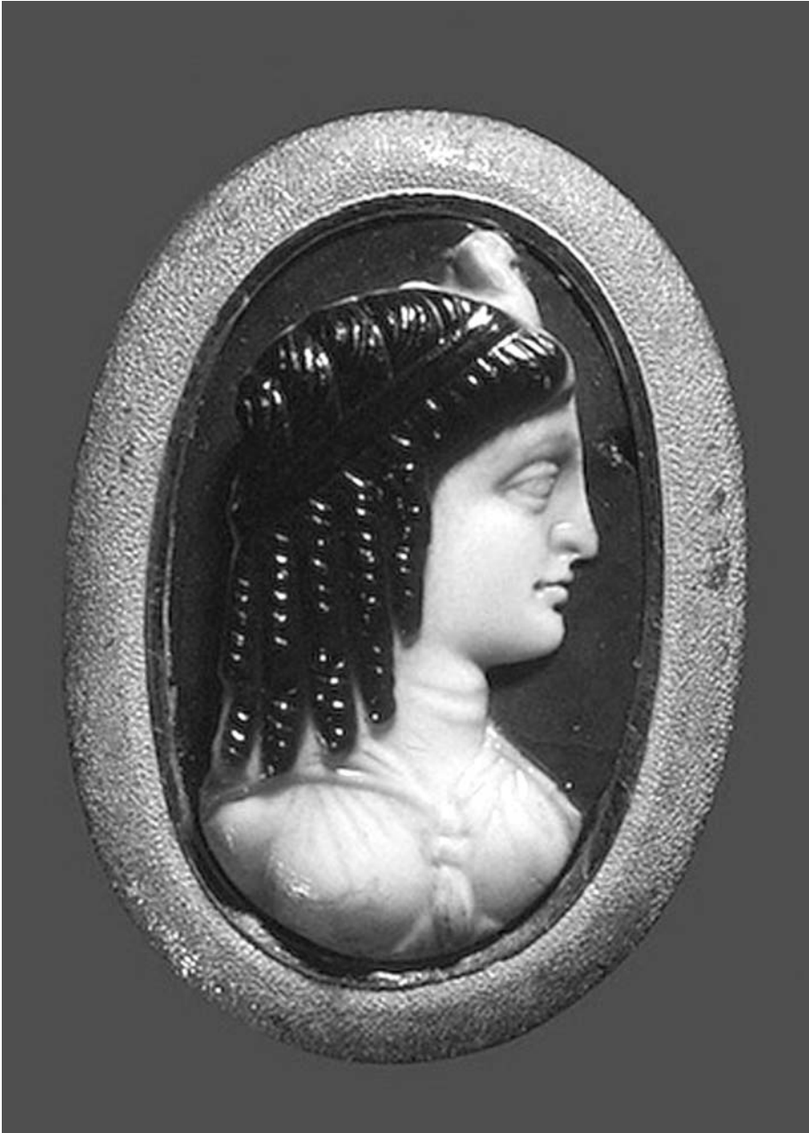
2. Entalle de sardonice. Berenice (esposa de Ptolomeo I Soter) como Isis. 281-275 a.C.. The State Hermitage Museum, St. Petersburg. 2,3 x 1 cm.