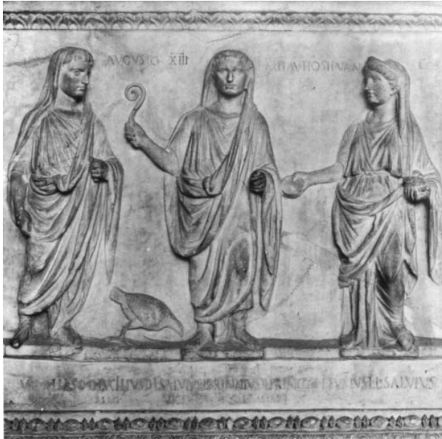
12. Escena dinástica en el altar del Vicus Sandaliarius . Museo de los Uffizi de Florencia. 1,50 m alt.