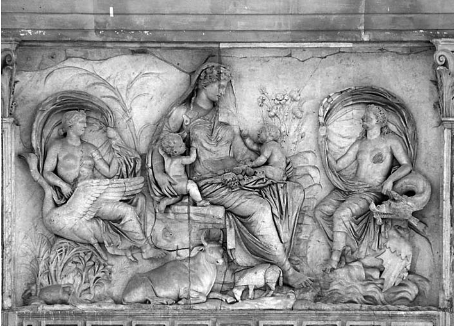
14. Jarra de fayenza. Arsinoe III con atuendo de sacerdotisa. Se le considera la primera reina que instauró cultos. British Museum, London. 32,4 cm alt.