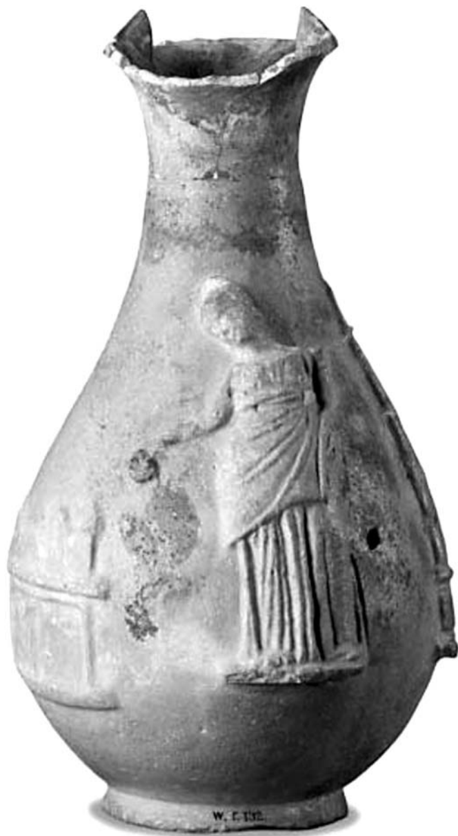
13. Altar del Ara Pacis (11 x 10 x 4,6 m). 13 a. C. Relieve alegórico de la fachada oriental.