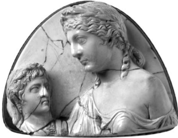
ii. Entalle de turquesa Marlborough. Livia como Venus Genetrix y Tiberio. Museum of Fine Arts, Boston. 3,ix 3,8 cm.