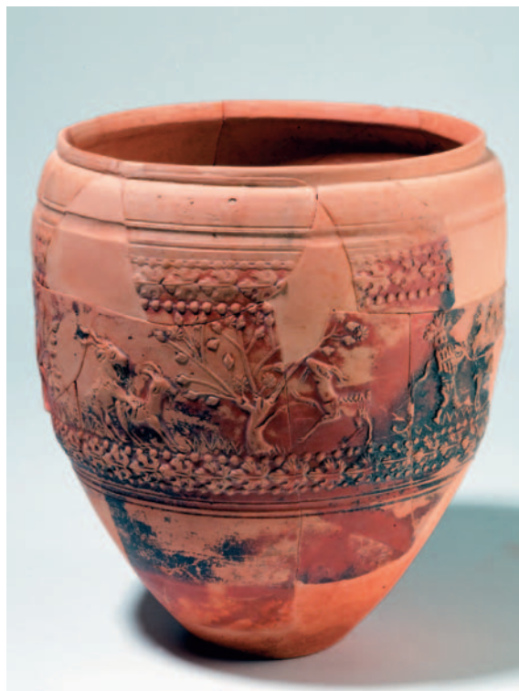
Fig. 4. Vaso de paredes finas de Verdullus, cuyo hallazgo en el solar del Círculo Católico detallan José Ignacio Royo Guillén et alii en su ponencia.

Idea parecida es la diseñada desde la Consejería de Cultura de la Junta de Extremadura en 1996, en colaboración con entidades de los municipios afectados, a través del tramo de la vía romana de la Plata, en esta