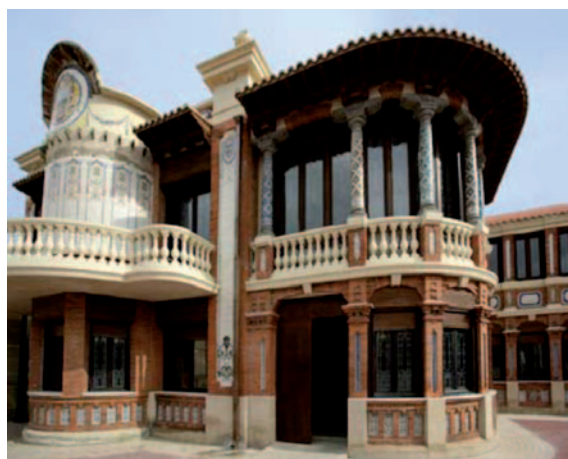
Fig. 5. Casa Solans, en Zaragoza, edificio modernista restaurado y reinaugurado en 2006. Hoy sede provisional del Secretariado del Agua de la ONU, es el único elemento que queda del antiguo complejo fabril de la harinera Solans.

En el presente hay ciudades que muestran un gran interés por la arqueología industrial, 19 los vestigios patrimoniales de diversa categoría, los antiguos palacios o casas señoriales, o bien los edificios que testimonian la evolución de la técnica y de la historia del proletariado, de la clase obrera, que contribuyó a hacer posible el desarrollo de los procesos técnicos. En la revalorización de estos restos, algunos monumentales, se están apoyando las políticas de dinamización y regeneración de los barrios deprimidos y las