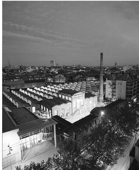
Fig. 6. Vista exterior de la antigua fábrica textil que hoy es el Museo de la Ciencia y de la Técnica de Cataluña, en Tarrasa.

El patrimonio industrial, interpretado en su contexto, puede ser un auténtico motor de desarrollo eco-