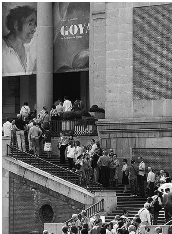
Fig. 1. Fila de espera para visitar la exposición de Goya en el Museo Nacional del Prado.

consumo cultural sin precedentes, y no siempre con criterios objetivos de aprendizaje; más bien se trata de incitar llegadas masivas de visitantes, de formar largas colas para lograr alzas mediáticas de las estadísticas. Es una especie de culto a la cultura que, de seguir así, solo llevará a la muerte del museo: «Desplegados los Goyas en el Prado, día tras día sin ningún acontecimiento que enaltezca su valor, actúan solo como pasivas piezas de arte, pero enaltecidas a través del evento se convierten en parte de un Congreso Eucarístico que invita a la comunión general». 3 (Fig. 1).